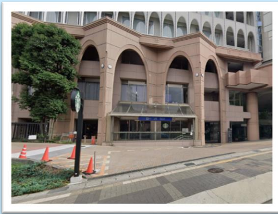
八事駅 5 番出入口前