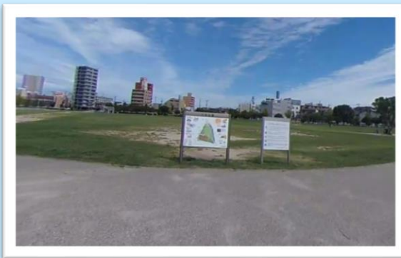
川名公園(ゴール地点)